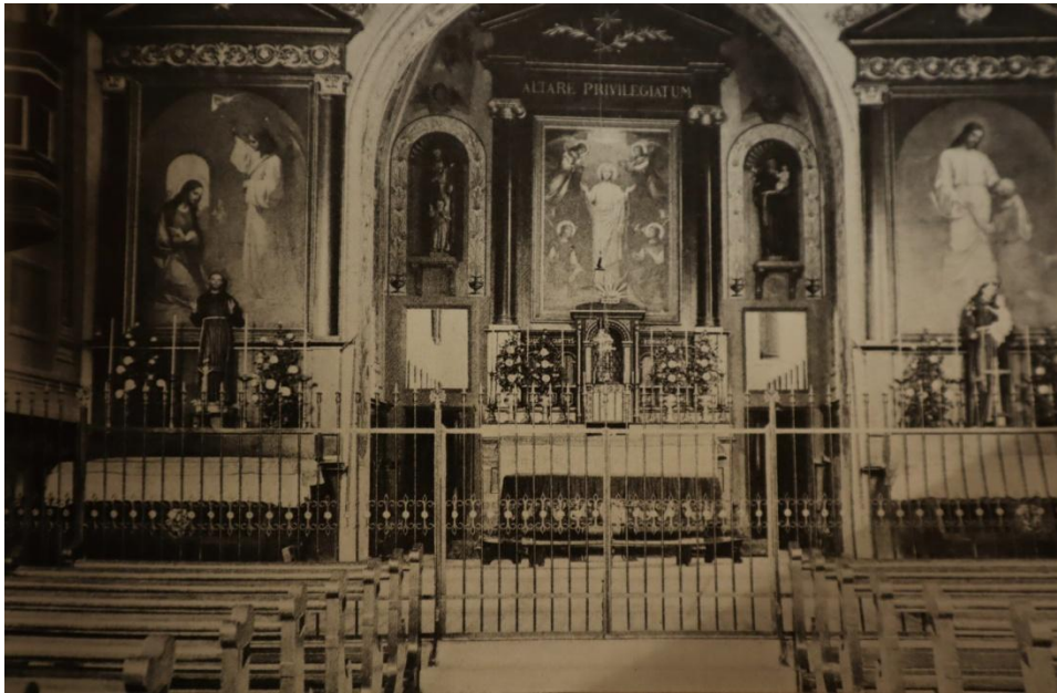
Klosterkirche vor der Renovation 1967-69

Das Chorgitter wurde entfernt, ein Volksaltar und ein Ambo (Leseputz) wurden aufgestellt. Damit die Brüder bei der Konventmesse aktiv teilnehmen konnten, wurde im äusseren Chor unter den rechten Fenstern die Mauer ausgebrochen, um Platz zu schaffen für die Klosterfamilie. Zusätzlich wurde auf der rechten Seite des Kirchenschiffes die Wand ausgebrochen, um Beichtstühle einzurichten und einen neuen Zugang zur Antonius Grotte zu schaffen.