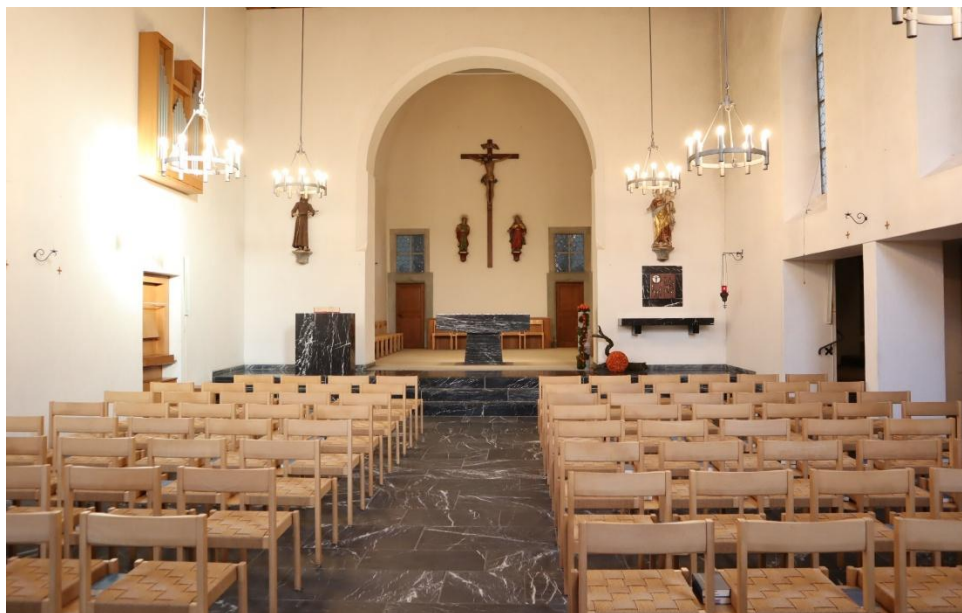
Klosterkirche nach 2000 mit der neuen Be- stuhlung

Das Chorgitter wurde entfernt, ein Volksaltar und ein Ambo (Leseputz) wurden aufgestellt. Damit die Brüder bei der Konventmesse aktiv teilnehmen konnten, wurde im äusseren Chor unter den rechten Fenstern die Mauer ausgebrochen, um Platz zu schaffen für die Klosterfamilie. Zusätzlich wurde auf der rechten Seite des Kirchenschiffes die Wand ausgebrochen, um Beichtstühle einzurichten und einen neuen Zugang zur Antonius Grotte zu schaffen.